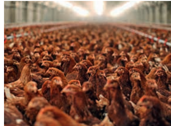
Bis 2020 streben unsere Nachbarn eine Begrenzung der Tierbestände an

Mein persönliches Fazit: Sowohl in der deutschen als auch in der niederländischen Bevölkerung hat der Tierschutz einen hohen Stellenwert. Überrascht hat mich, dass nur weniger als 5% der Niederländer Vegetarier sind, in Deutschland sind es rund 10 %. Wie bei uns auch, gibt es in Holland Gesetze und Regelungen zum Umgang mit Tieren. Bei unseren Nachbarn scheint die Politik jedoch eher gewillt zu sein, Änderungen und Innovationen zum Wohl der Tiere in die Tat umzusetzen.