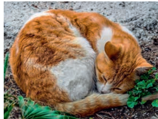
In den Niederlanden leben rund 1 Million Katzen auf der Straße

Caritasverband für die Region Düren-Jülich e.V. Alten- und Pflegezentrum St. Nikolaus